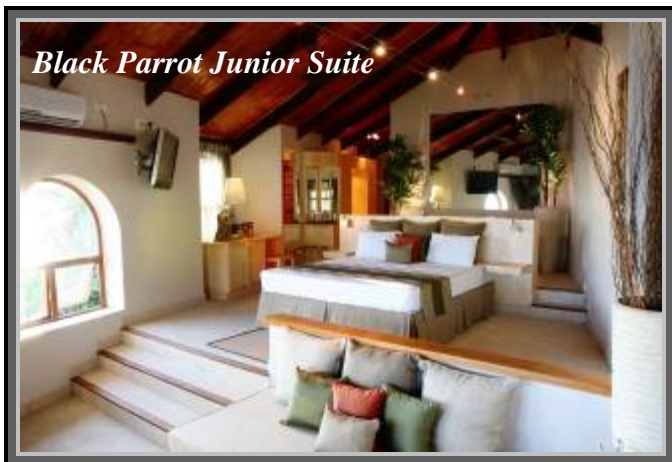
Black Parrot Junior Suite