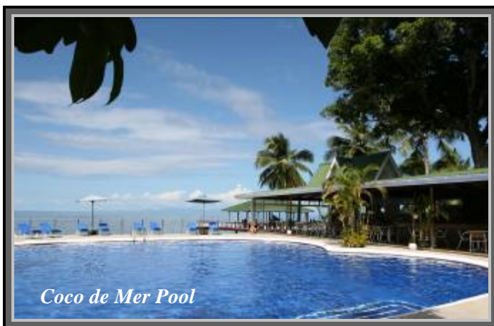
Coco de Mer Pool

L'hôtel se situe sur des plages diverses, faisant part de l'Anse Bois de Rose, une baie large et tranquille. Les vents et marées peuvent causer le dépôt de zostère pendant certaines périodes de l'année (normalement de mai à octobre). Les hôtes ont toujours accès à des terrains de bain de soleil amples; terrasses de sable spacieuses; hamacs suspendus entre les palmiers, et chaises longues. Les deux piscines superbes, dont l'une en forme de coco de mer, surplombent l'Océan Indien et sont considérées d'être parmi les plus belles piscines des Seychelles. Transport gratuit à la plage de l'Anse Lazio plusieurs fois la semaine. Les hôtes de l'hôtel peuvent se rendre à pied ou bien aux vélos de l'hôtel aux nombreuses baies de sable privées qui se trouvent sur cette côte.