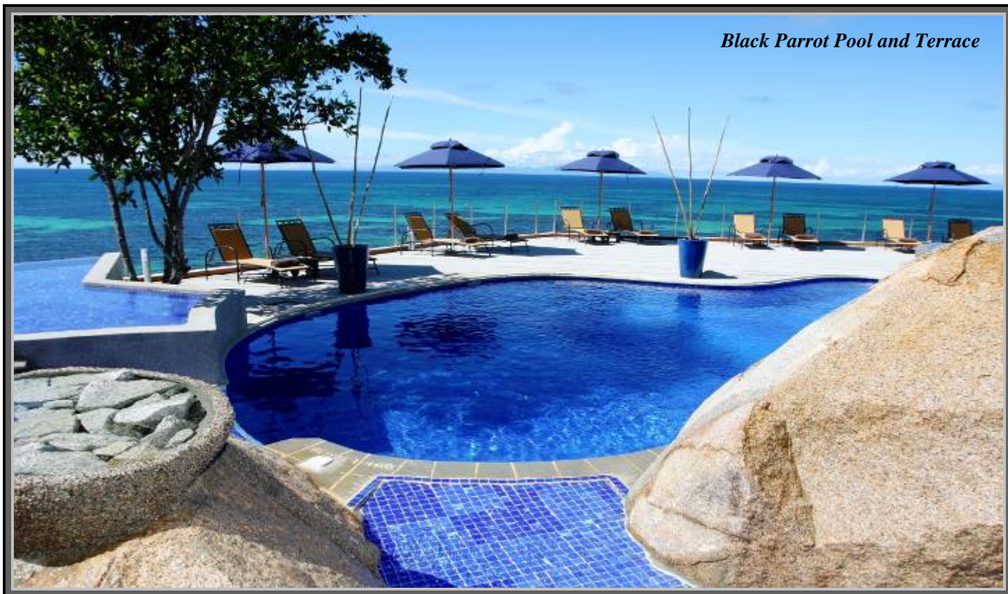
Black Parrot Pool and Terrace